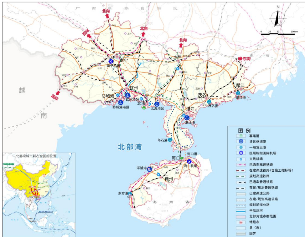
图2 北部湾城市群交通示意图

（十三）完善城际综合交通网络。畅通省际骨干通道，规划建设湛江至海安（海口）高铁，推动建设南宁至湛江高速公路。整合琼州海峡两岸港口资源，打造琼州海峡客滚运输一体化投资运营平台等，推进琼州海峡港航一体化。建设高效便捷的都市圈交通网。贯通广西滨海公路、海南环岛旅游公路，形成环湾交通通道。推广交通“一卡通”服务和二维码“一码畅行”。（交通运输部、国家铁路局、中国国家铁路集团有限公司）